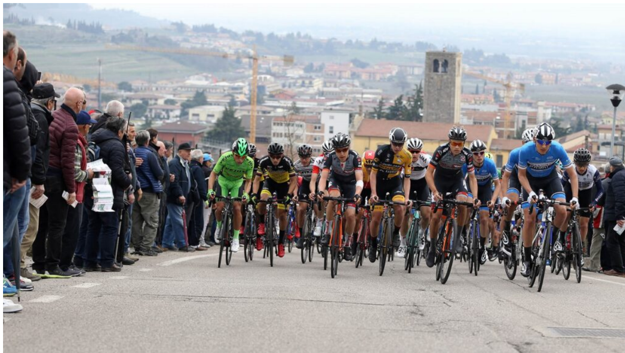
03/04/18 – Negrar (VR) – 57 Gp Palio del Recioto – – nella foto: passaggio del gruppo

Percorso impegnativo come vuole la tradizione, dunque, quello che nella prima parte comprende sei tornate del circuito di 18,6 chilometri caratterizzato dalle salite del Colle Masua e di Jago.