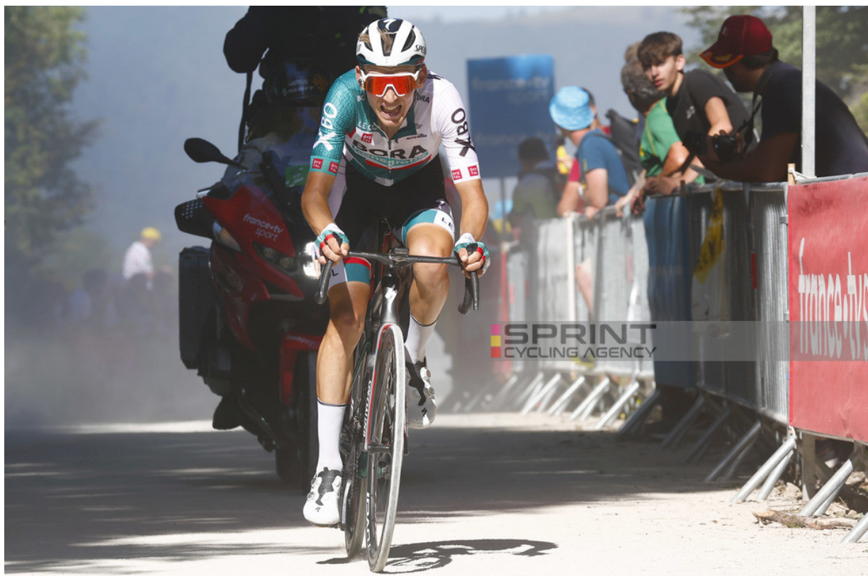
Tour de France 2022 – 109th Edition – 7th stage Tomblaine – La Super Planche des Belles Filles 176 km – 08/07/2022 – Lennard Kamna (GER – Bora – Hansgrohe)

L'andatura imposta dalla UAE Emirates miete le prime vittime illustri quando si staccano Jakob Fuglsang, Neilson Powless e soprattutto Aleksandr Vlasov, reduce da una caduta nella frazione di ieri. Il lavoro di Rafal Majka lancia la prima rasoia del Re in Giallo, che fa la selezione definitiva.