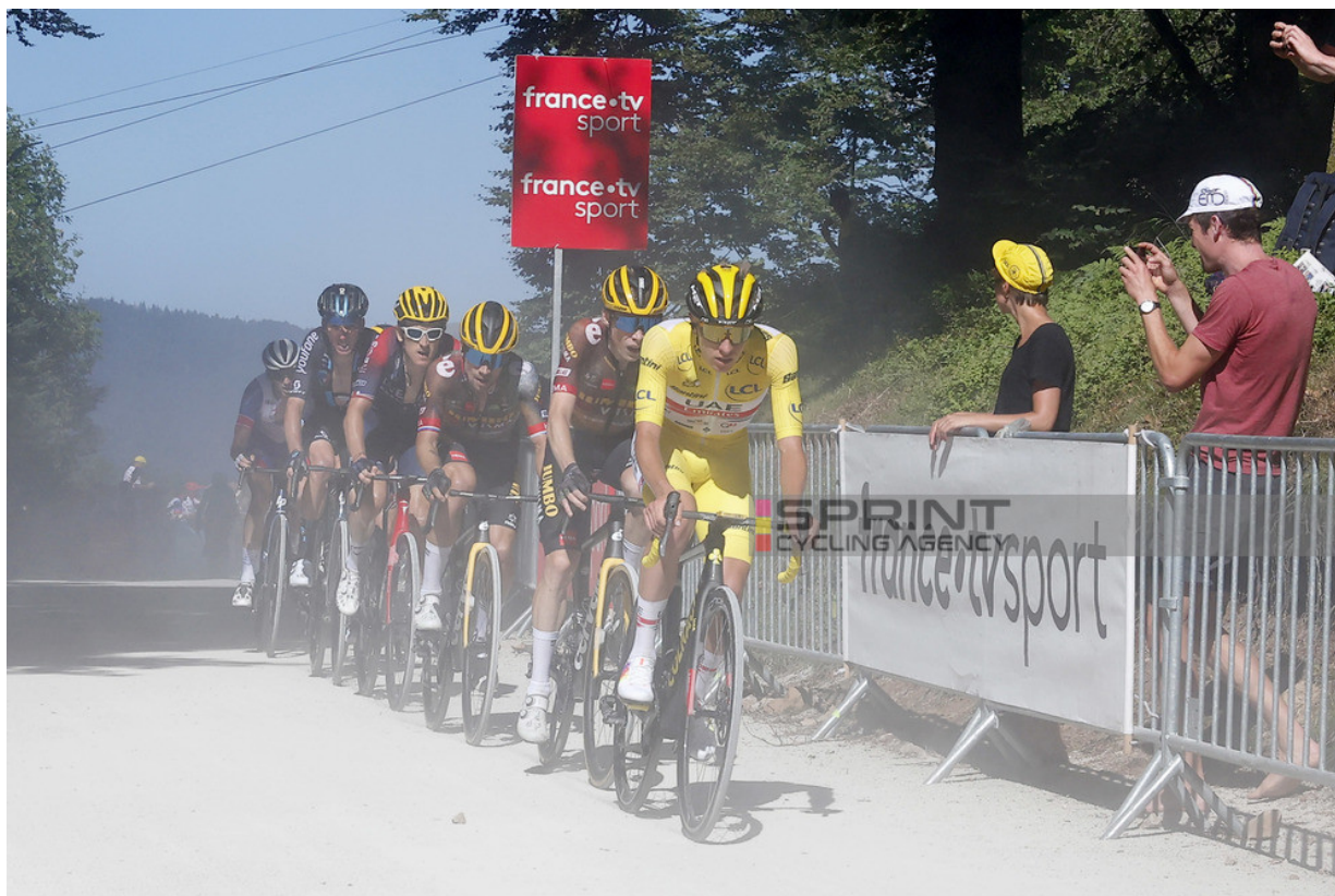
Tour de France 2022 – 109th Edition – 7th stage Tomblaine – La Super Planche des Belles Filles 176 km – 08/07/2022 – Tadej Pogacar (SLO – UAE Team Emirates) – Jonas Vingegaard (DEN – Team Jumbo – Visma) – Primož Roglic (SLO – Team Jumbo – Visma) – Geraint Thomas (GBR – INEOS Grenadiers)

Dopo poco vengono raggiunti da Imanol Erviti, Dylan Teuns, Simon Geschke e Cyril Barthe, mentre Ciccone viene ripreso dal gruppo. I sette battistrada iniziano insieme la seconda salita di giornata, il Col des Croix, con caratteristiche molto simili alla precedente, raggiungendo anche 3? di vantaggio.