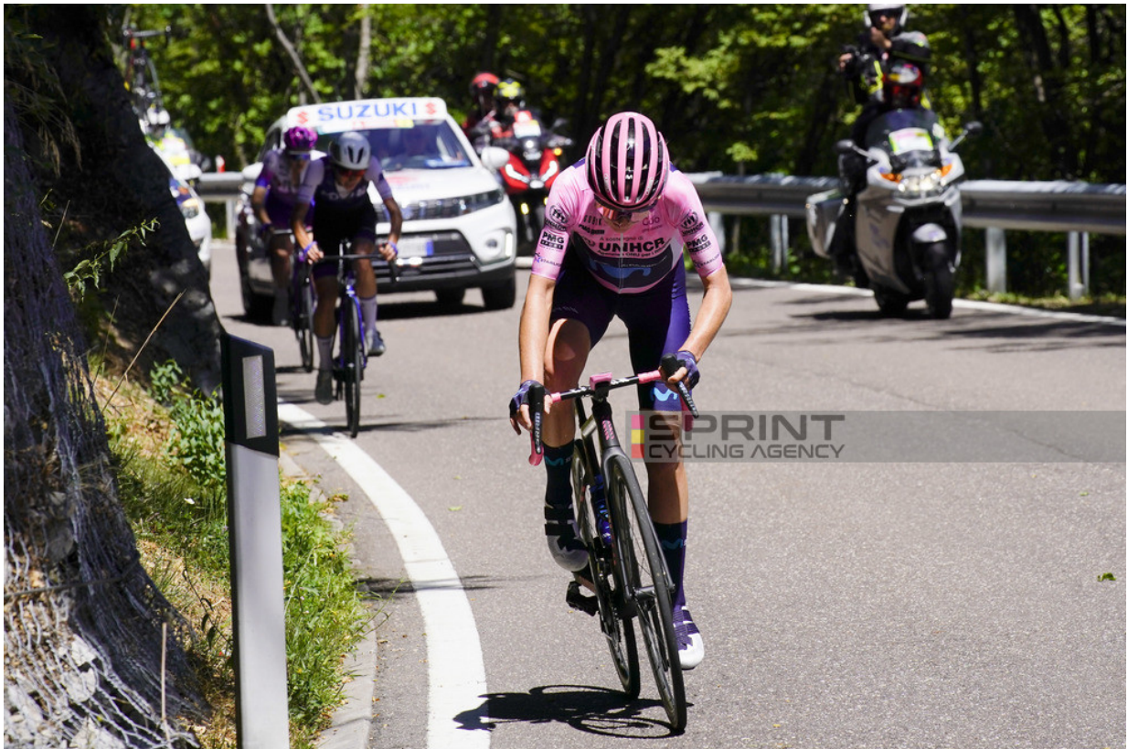
Giro d'Italia Donne 2022 – 33rd Edition – 8th stage Rovereto – Aldeno 104,8 km 08/07/2022 – Annemiek Van Vleuten (NED – Movistar Team)

Le prime fasi della corsa sono caotiche come in quasi ogni frazione di questa corsa. Provano in tantissime ad evadere dal gruppo, tra cui anche Lucinda Brand. Non si sviluppa mai una vera e propria fuga, ma sulla prima della due ascese di giornata si avvantaggiano diverse atlete di grande qualità.