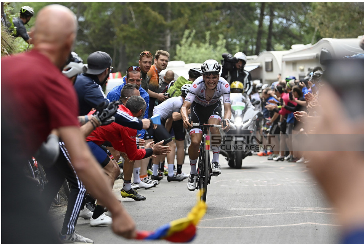
Giro d'Italia 2022 – 105th Edition – 16th stage Salo- Aprica 202Ékm – 24/05/2022 – Valico di Santa Cristina – Joao Almeida (POR – UAE Team Emirates)

Almeida ha rivelato le sue emozioni con un post sul suo profilo Instagram nella serata di ieri: “Non so nemmeno da dove cominciare. Questa mattina la tristezza ha riempito il mio cuore. Forse perché sono ancora giovane e non ho mai avuto un intoppo come questo. Amo quello che faccio, è la mia ragione di vita. E amo ancor di più il Giro d'Italia, ha un significato speciale per me. Ma capisco che le battute d'arresto sono parte del percorso e le accetto” .