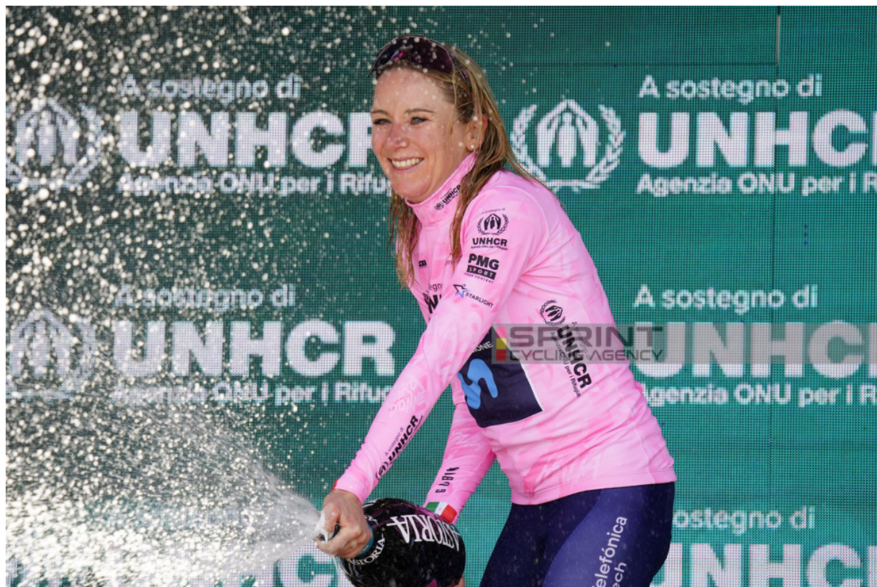
Giro d'Italia Donne 2022 – 33rd Edition – 9th stage San Michele Alladige – San Lorenzo Dorsino 113 km 09/07/2022 – Annemiek Van Vleuten (NED – Movistar Team)

Gli attacchi in discesa dal Passo Daone e poi sulla risalita verso San Lorenzo Dorsino da parte di Marta Cavalli (che oggi ha avuto al seguito corsa tutta la famiglia) non hanno intimorito il carattere della Maglia Rosa, che alla partenza di San Michele all'Adige è andata a complimentarsi con la più diretta inseguitrice, dimostrando grande sportività nei suoi confronti.