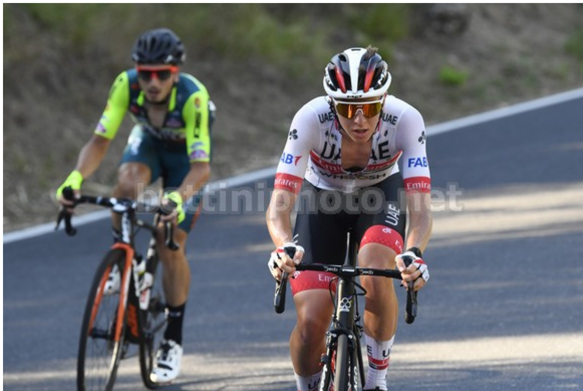
Tadej Pogacar (SLO - UAE - Team Emirates)