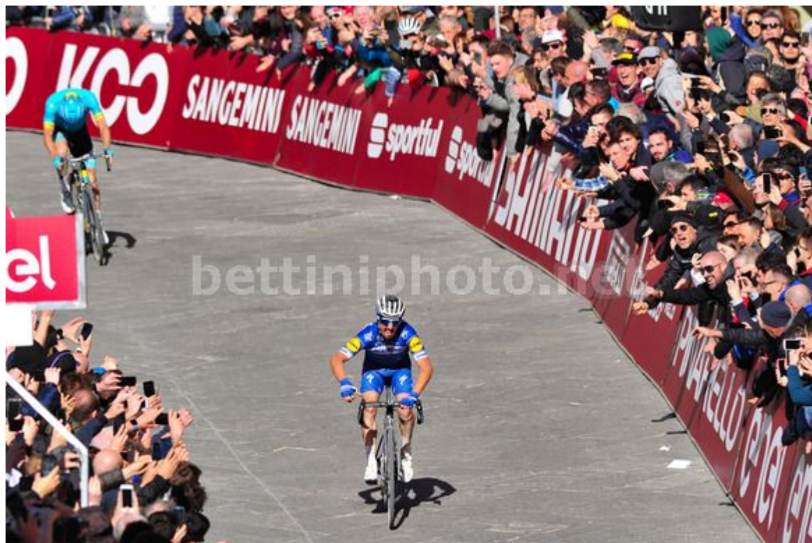
Strade Bianche 2019 – 13th Edition – Siena – Siena 184 km – 09/03/2019 – Julian Alaphilippe (FRA – Deceuninck – Quick Step) – Jakob Fuglsang (DEN – Astana Pro Team)

Il percorso femminile, di fatto, ricalca quello maschile nella prima parte, fino al chilometro 55. Da lì evita un paio di settori in sterrato per dirigersi verso il tratto di San Martino in Grania e rientrare nel percorso maschile, senza percorrere il lungo tratto di Monte Sante Marie. Il finale, invece, è identico quello degli uomini, con Le Tolfe decisive ai meno 12 prima dello strappo verso il traguardo di Siena per un totale di 136 chilometri.