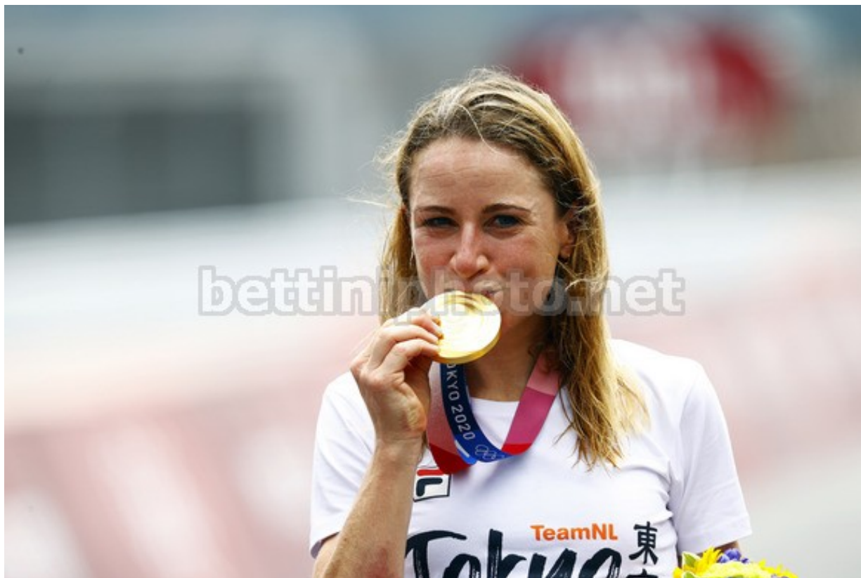
Tokyo 2020 Olympic Games – Olimpiadi Tokyo 2020 – Women's Individual Time Trial – Fuji Speedway 22,1 km – 28/07/2021 – Annemiek Van Vleuten (Netherlands)

Marlene Reusser conferma la sua grande qualità in questa disciplina e va a regalare alla Svizzera e al Team Alé – BTC Ljubljana (unico team World Tour italiano) una bellissima medaglia d'argento scalzando Anna Van der Breggen, alla quale va il bronzo. Nulla da fare per Chloe Dygert: la americana ha pagato il rientro dopo diversi mesi a causa del drammatico incidente avvenuto nella prova a cronometro dei Mondiali 2020 a Imola, in cui si era provocata una impressionante ferita alla coscia sinistra; per lei comunque un confortante settimo posto.