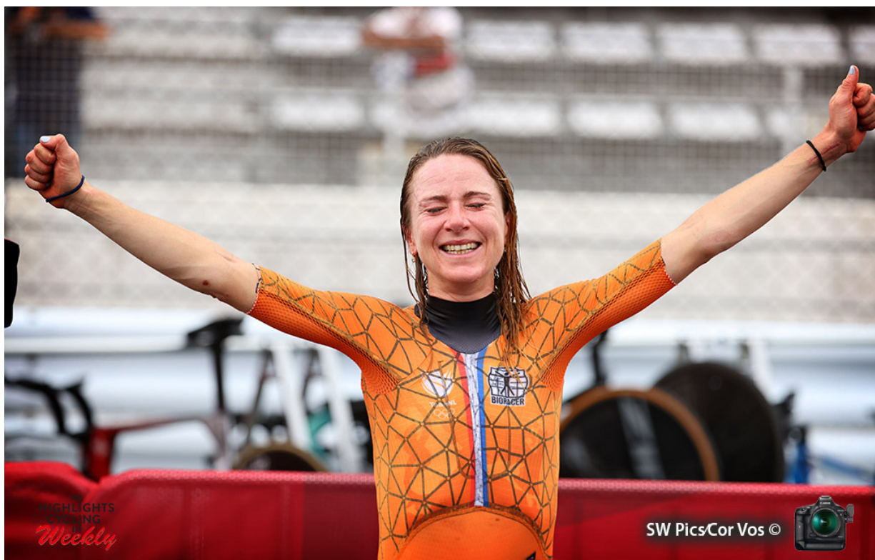
Annemiek Van Vleuten

Tra le favorite principali alla vigilia, Annemiek Van Vleuten vola come un treno sin dai primi metri, andando a riprendere anche Emma Nørsgaard (Danimarca), partita tre minuti prima. In mezzo a loro la quarantaseienne statunitense Amber Neben se la giocava con le più forti, così come Grace Brown (Australia). Gli intertempi della olandese sono letteralmente polverizzati e andrà a terminare in 30'14" con la stratosferica media di 43.9 km/h!