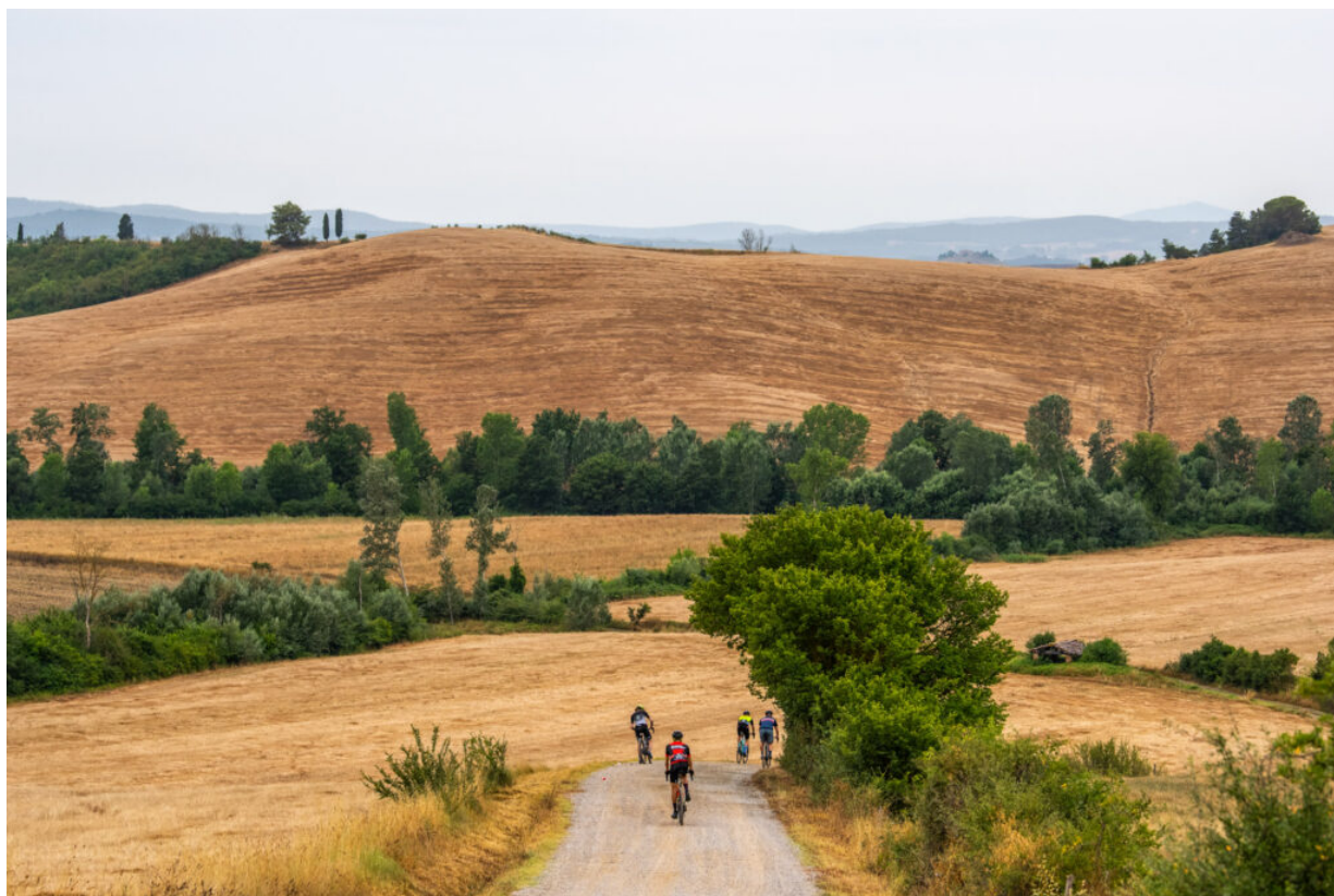
NOVA Eroica 2021

Alle ore 19.30 aprirà il “Ristorante di Strada” in Piazza Matteotti che, con i suoi stand enogastronomici, proporrà piatti tipici toscani come pici al sugo, pasta al forno, panzanella, carne chianina e cinta senese alla brace, verdure fritte, dolci fatti in casa, per una serata di buon cibo e musica live.