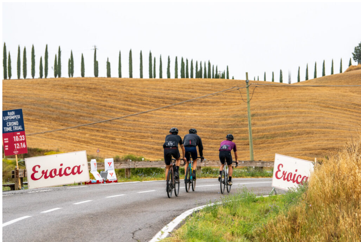
NOVA Eroica 2021

Su Facebook: Nova Eroica oppure Proloco Buonconvento