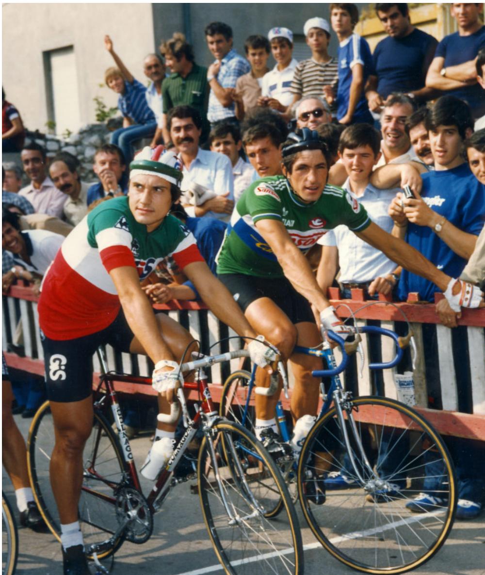
Francesco Moser (Sanson) – Giuseppe Saronni – 1980

Per ritrovare altri duelli epici sfidanti bisogna aspettare le rivalità fra Adorni e Gimondi e fra Gimondi e Motta, ma l'avvento di Merckx, un asso pigliatutto, mortifica le ambizioni di molti avversari.