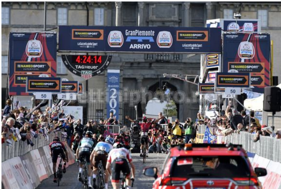
Gran Piemonte 2019 – 103th Edition – Aglie’ – Santuario di Oropa 183 km – 10/10/2019 – Egan Bernal (COL – Team INEOS)