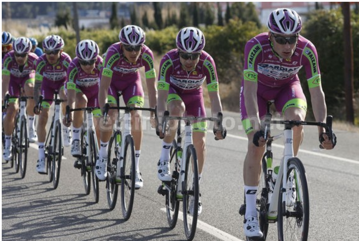
Bardiani CSF Faizane' – photo Luis Angel Gomez/BettiniPhoto©2021