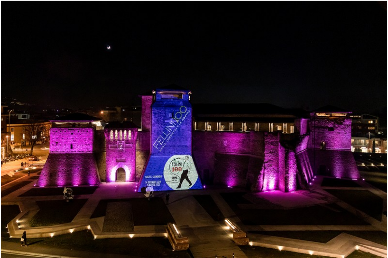
Castel Sismondo a Rimini, con dedica a Federico Fellini nel centenario della nascita