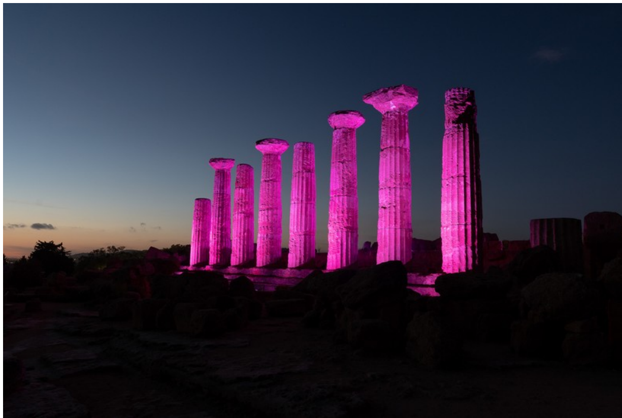
Le Colonne del Tempio di Ercole (Valle dei Templi) di Agrigento. Qui terminerà la prima frazione italiana della Corsa Rosa.