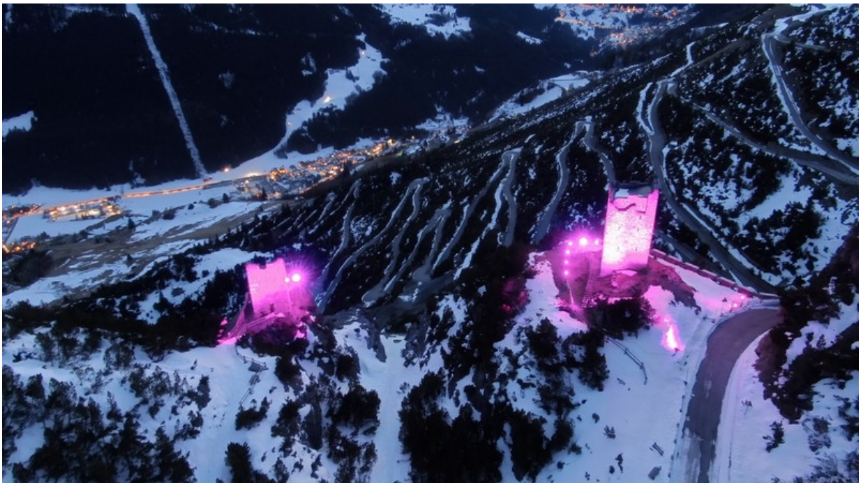
Le Torri di Fraelè, Laghi di Cancano, Parco dello Stelvio