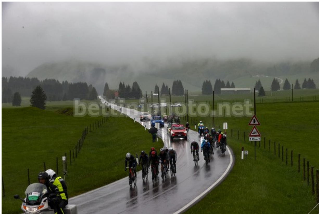
Giro d'Italia 2021 – Cortina d'Ampezzo – 24/05/2021 – Scenery