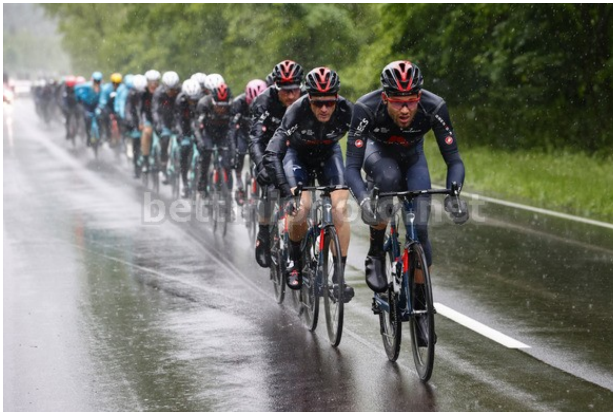
Giro d'Italia 2021 – 16th stage Sacile – Cortina d'Ampezzo 153 km – 24/05/2021 – Filippo Ganna (ITA – Ineos Grenadiers)