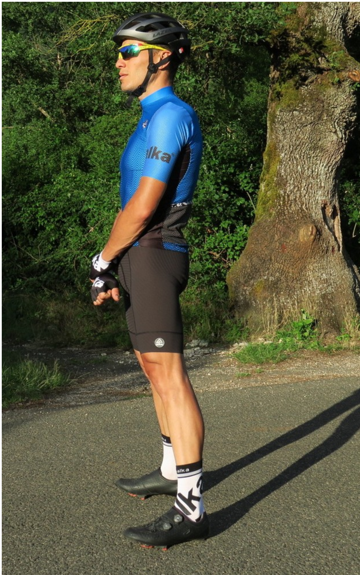
Tessuti dall'alto contenuto tecnico quelli impiegati