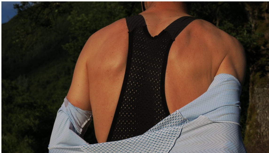
• Bretelle in rete traspirante