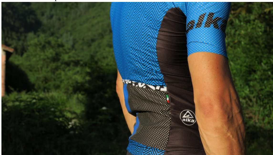
• Accesso ampio per le tre tasche posteriori