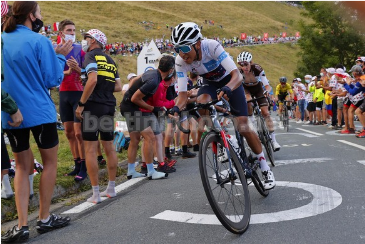
Tour de France 2020 – 107th Edition – 8th stage Cazerès – Loudenvielle 141 km – 05/09/2020 – Col de Peyresourde – Egan Bernal (COL – Ineos Grenadiers)

Non è l'ultima spiaggia, ma Egan Bernal (INEOS-Grenadier) è chiamato a dare un segnale. Lo scatto di oggi non ha creato grossi problemi agli avversari, ma dopo il tempo perso ieri ha voluto lanciare un segnale. Sulla carta, una frazione più impegnativa potrebbe esaltarne le doti, ma la sensazione è che in questo momento il problema siano le gambe del corridore colombiano.