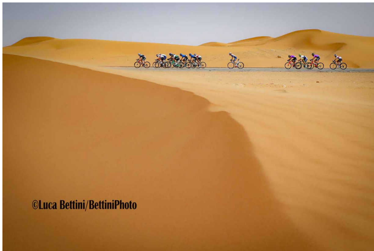
Prima classificata: Strade di sabbia, foto ripresa nel deserto dell'Arabia Saudita

Ecco le 3 foto premiate nel 4° concorso fotografico “The Best of Cycling” 2020 categoria SCENERY.