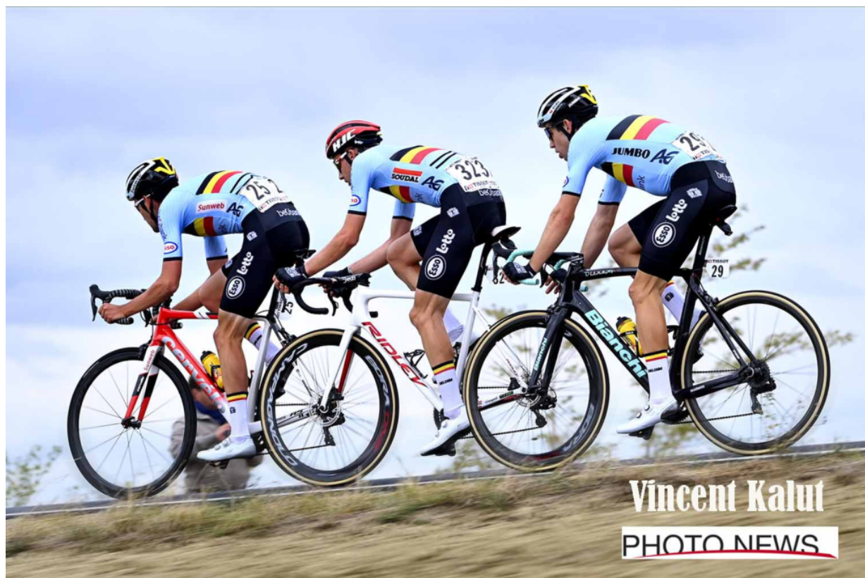
Seconda classificata: Tre bici...quattro ruote

Nella cronometro iniziale dl Giro a Monreale, il campione del mondo Filippo Ganna si prende la maglia rosa