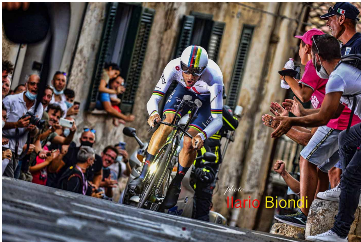
Prima classificata ICategoria Emotion: Vincitrice “L’iride cambia colore”

Nella cronometro iniziale dl Giro a Monreale, il campione del mondo Filippo Ganna si prende la maglia rosa