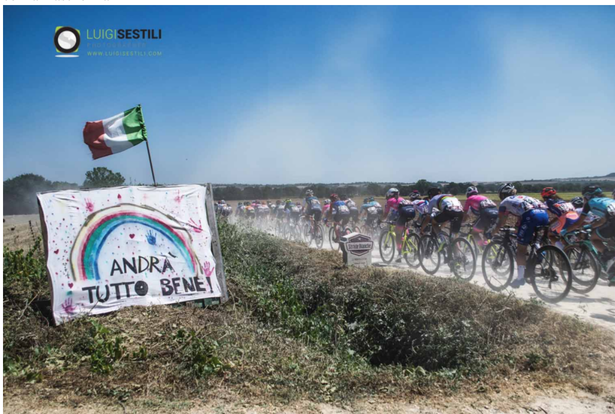
Terza Classificata: “Andrà tutto bene”. Foto scattata nella prima gara della stagione alle Strade Bianche, dopo lo stop per il Coronavirus

Di seguito le 3 foto premiate nel 4° concorso fotografico “The Best of Cycling” 2020 categoria EMOTION