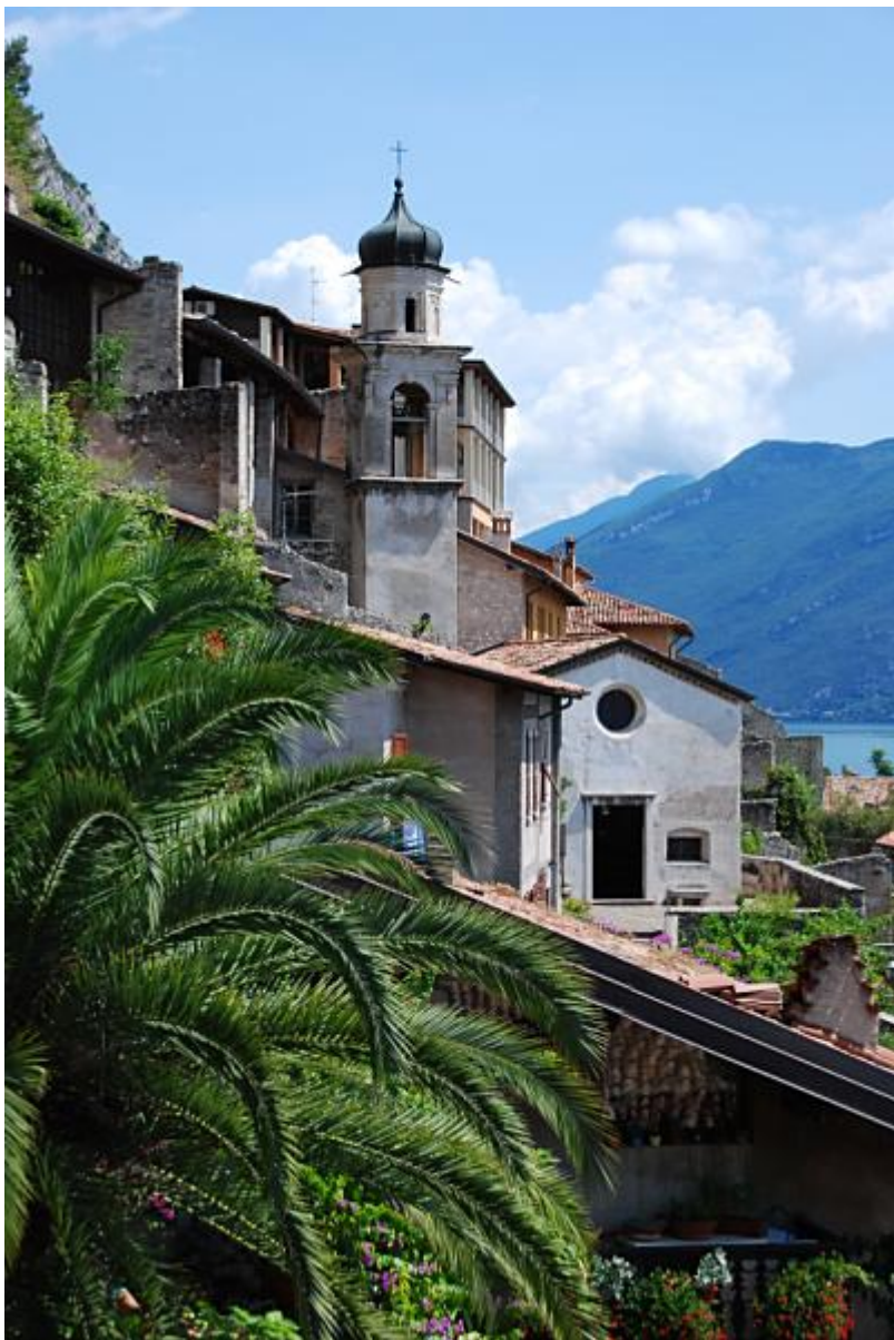
La chiesa di San Rocco

All'inizio della pista ciclabile si possono vedere le limonaie , strutture costruite sul lago per riparare gli alberi di limone. Le limonaie sono strutture tipiche del Lago di Garda, costruite intorno al 1700 e ricordate anche dal poeta Goethe nei suoi scritti. Costruite in pietra, sono strutture chiuse su tre lati per assicurare l'esposizione delle piante a sud-est in direzione del sole. Aperte al pubblico, sono disposte su diversi piani e contengono piante di cedri, pompelmi, mandarini, mandaranci, chinotti, clementini e kumquat. Sulle strade che dal centro del paese conducono al lungo lago si può ammirare anche la Chiesa di San Rocco , costruita nella prima metà del XVI secolo dopo lo scampato pericolo della pestilenza. Nei secoli successivi la Chiesa venne affrescata all'interno e venne costruito il campanile: dopo i danni subiti nel corso del secondo conflitto mondiale venne riqualificata e ristrutturata. Nella visita all'interno non si può non notare l'affresco sul fondo dell'abside che ritrae la Madonna fra i Santi Rocco e Sebastiano.